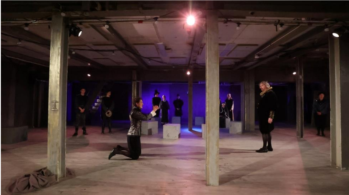
På Shakespearefabriken i Vadstena är repetitionerna i full gång inför lördagens premiär.